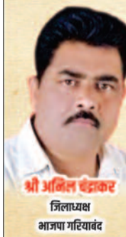
श्री अरुण चंद्रकार जिलाध्यक्ष भाजपा गरियाबंद