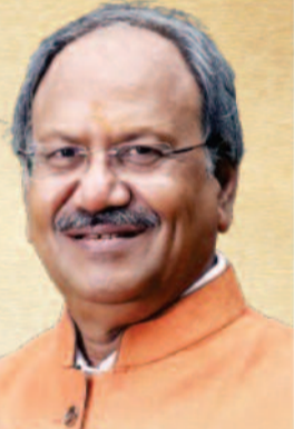
श्री बृजमोहन अग्रवाल सांसद रायपुर लोकसभा