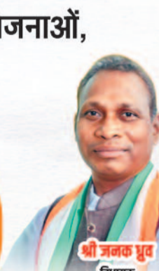
श्री जनक पुर विधायक विन्दावनगढ़ विधानसभा